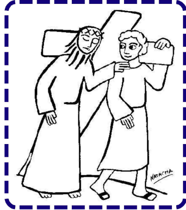
SIMÓN DE CIRENE LE AYUDA