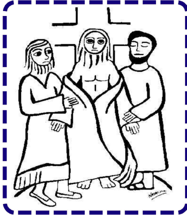
CARGA CON LA CRUZ