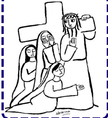
LAS MUJERES LLORAN POR ÉL