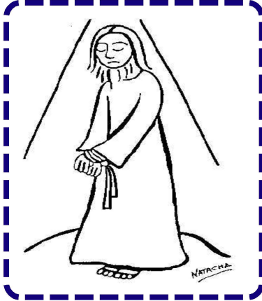
CONDENADO A MUERTE