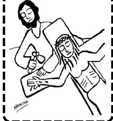
LO CLAVAN EN LA CRUZ